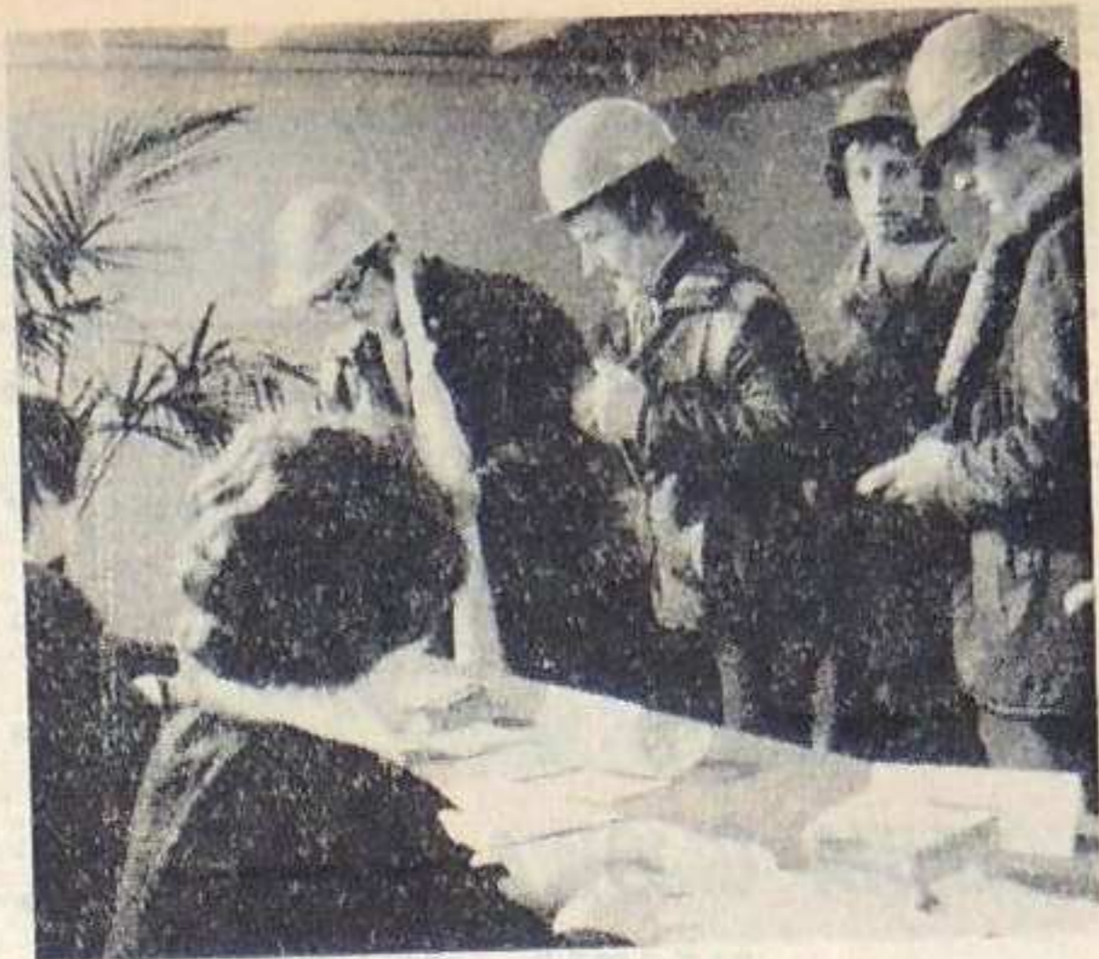
W lokalu wyborczym przy ul. Sadawej.