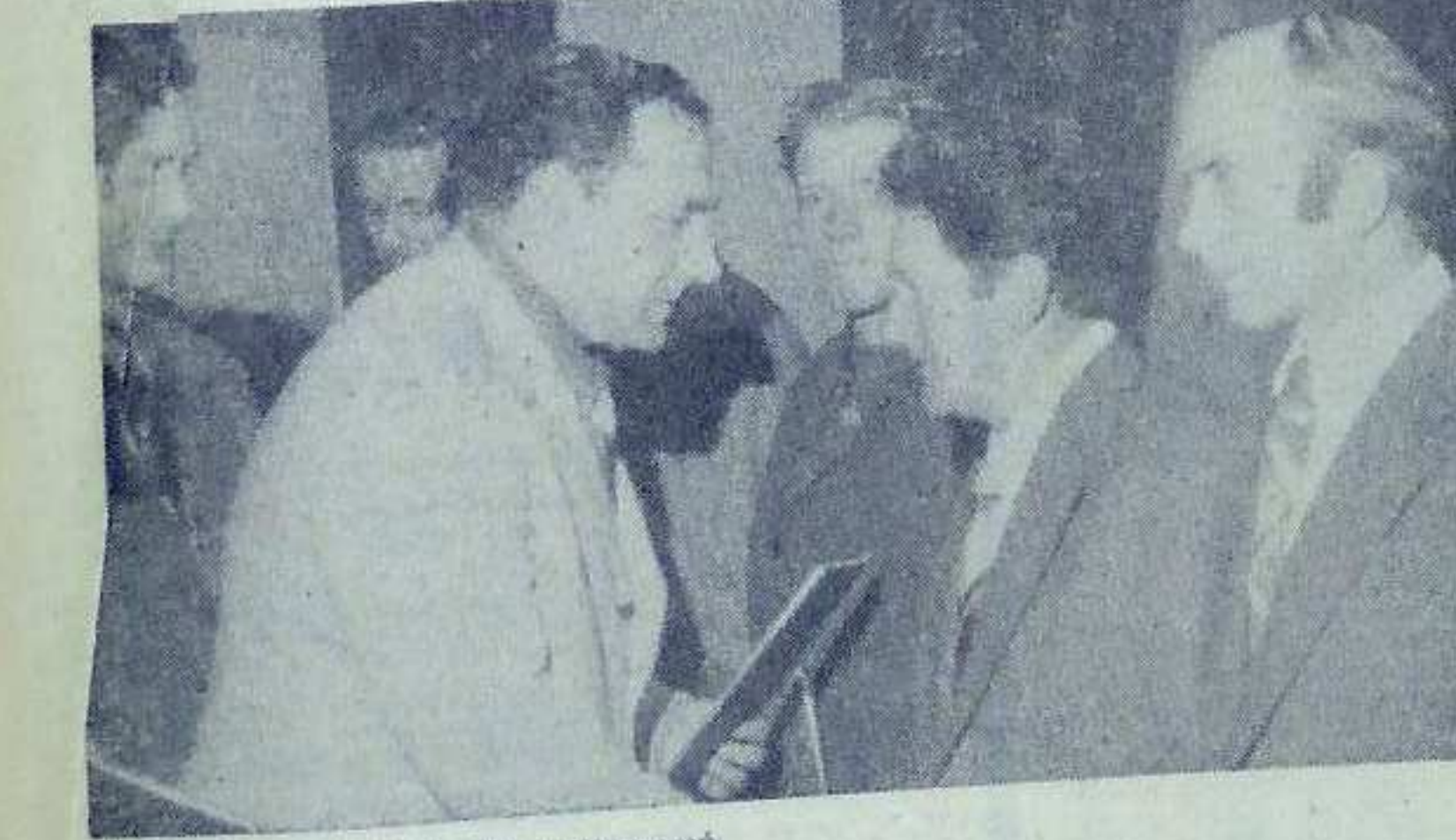
Moment wręczania dyplomów i odznaczeń.

— Dziękujemy za rozmowę. Kończąc ten pierwszy list, następnym przesyłam za dwa tygodnie. Pozdrowienia dla budowniczych i hutników naszego kombinatu od kolegów z budowy gazociągu!