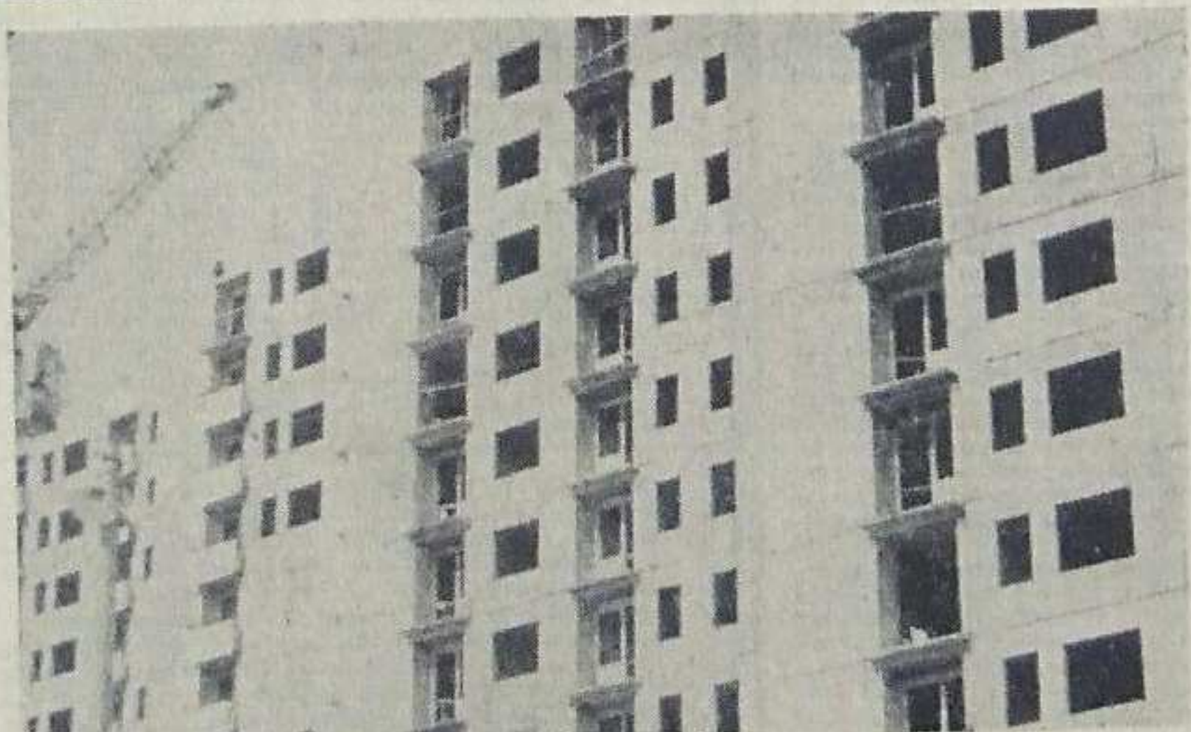
W osiedlu mieszkaniowym A i B w Golonogu zamieszka kilka tysięcy osób. Nabiera ono już architektonicznego kształtu. Zakończono budowę pierwszego wstępuca do którego niebawem uprowadzą się pierwsi lokatorzy.