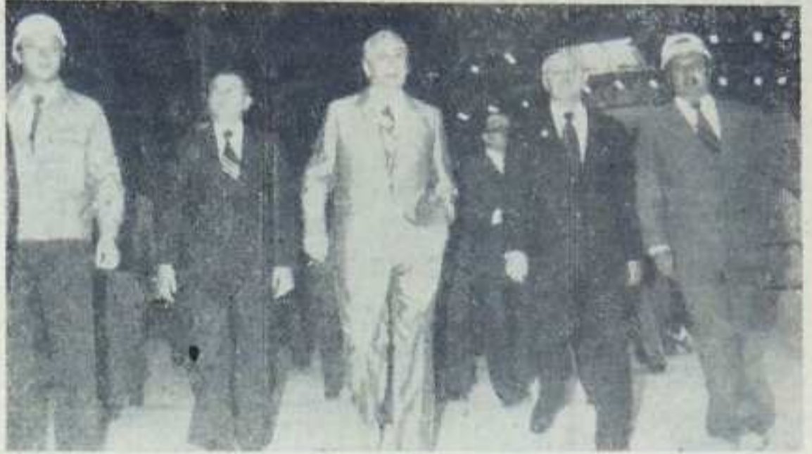
Dostojni Goście w naszej, obtrzymłej hali walcowni dużej.

Wizyta Dostojnych Gości w Kombinacie i na placu jego budowy związana była z uruchomieniem największego w Hucie wydziału — walcowni dużej. Gospodarze mogli zameldować o zakończeniu podstawowego etapu budowy Huty Katowice.