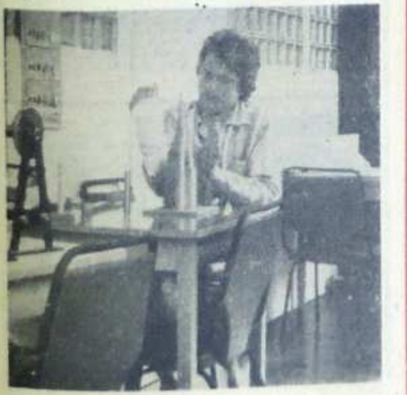
Pod koniec udanej operacji pacjent wykonuje przepisywany zestaw ćwiczeń.