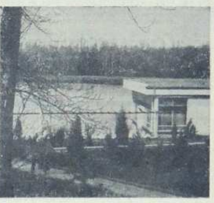
Ośrodek w Rogoźniku cieszy się dużą popularnością.

WESOŁA ZABAWA WIELE ATRAKCJI DO BARDZO UDANYCH należą zaliczyć festyn w Rogoźniku, zorganizowany przez dział usług poczynionych i Rada Zakładowa Szkoły Ekonomiczno-Technicznej Kombinatu. Na obiektach sportowo-rekreacyjnych tego ośrodka bawiono się i wypoczywano całymi rodzinami. Każdy mógł znaleźć coś dla siebie. Kto lubi rozrywkę kultu ruda, ten mógł spędzić czas w amfiteatrze, kto zaś chciał wypocząć aktywnie, ten miał do dyspozycji obiekty sportowe i przystań wodną. W amfiteatrze wypoczywających zabawiali artystyczne zespoły amatorskie z Katowic. Wiele udechy miało podczas konkursów, w których udział brały całe rodziny. Wśród quizów i konkursów, były także, jak zrobienie szalik na drutach przez młotowicę, albo wyharanie się przez panie umiejętnością strzelać mekskami, np.