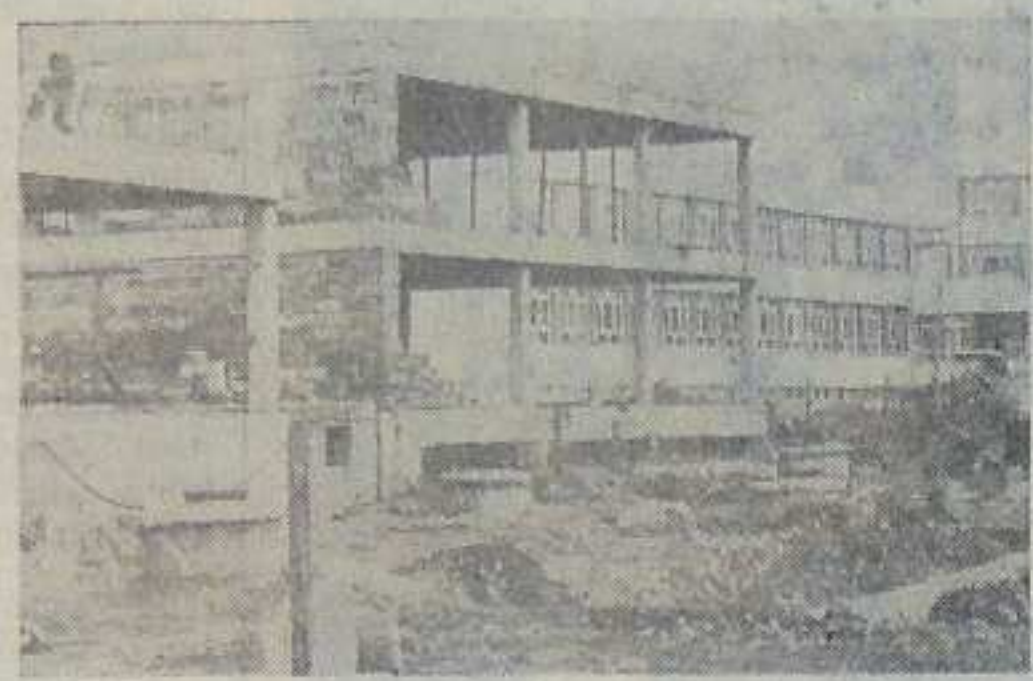
PO ZAKOŃCZENIU budowy szkoły podstawowej na osiedlu C-2 w Zagórzach budowlani natychmiast wznowili prace przy zlozku i przedszkolu...