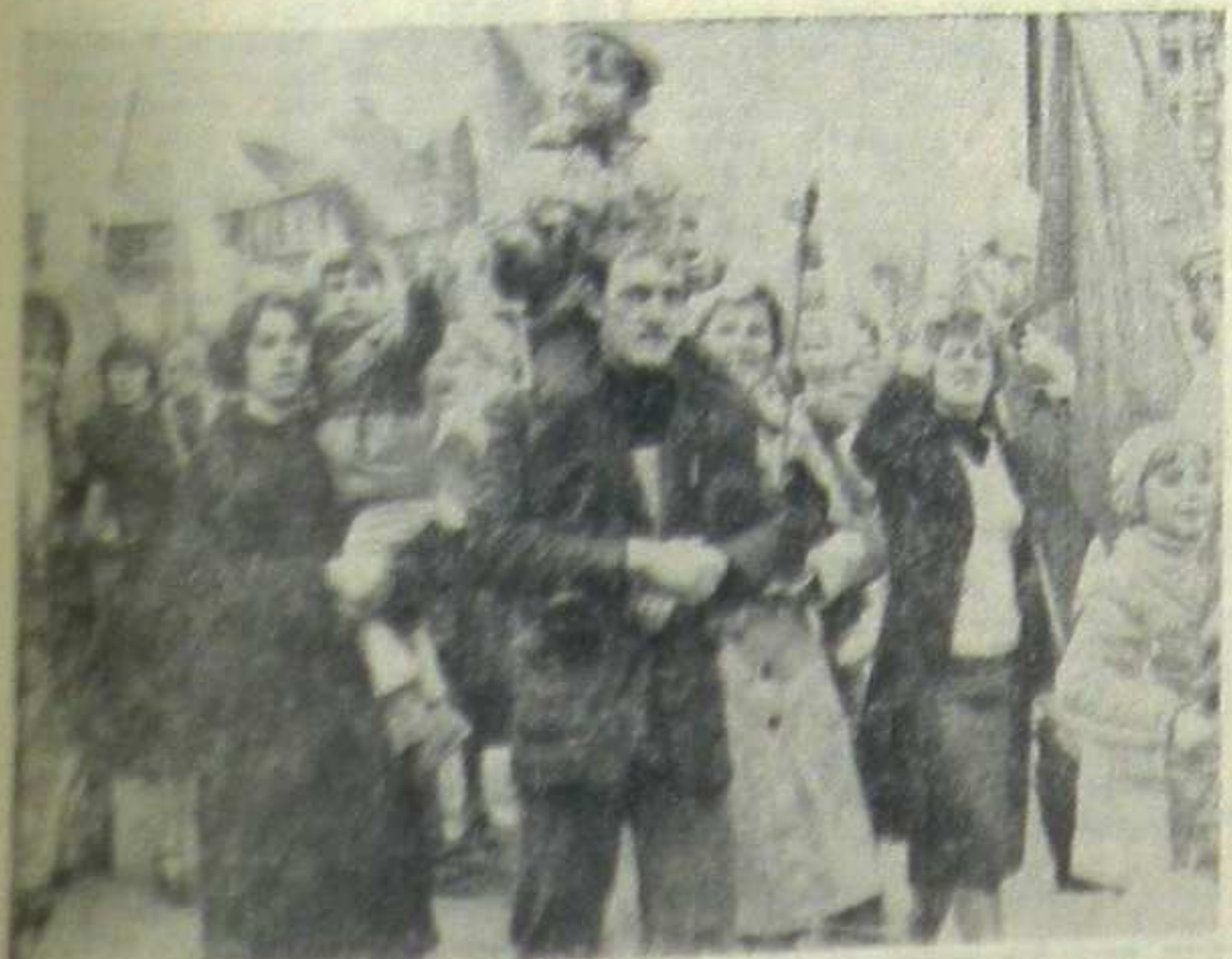
W pogodnym nastroju, zadawaleni z wyników pracy obchodziliśmy tegoroczne Święto i Męj. Męjowski z obchodem zmagającym na str. 4.

Na ręce ministra Iwana Kazanca złożono serdeczne podziękowania radzieckim metalurgom za dotychczasową pomoc w budowie i uruchamianiu wydziałów Kombinatu. Radzieckiego gościa zapoznano z perspektywami rozbudowy Kombinatu w oparciu o współpracę ze Związkiem Radzieckim.