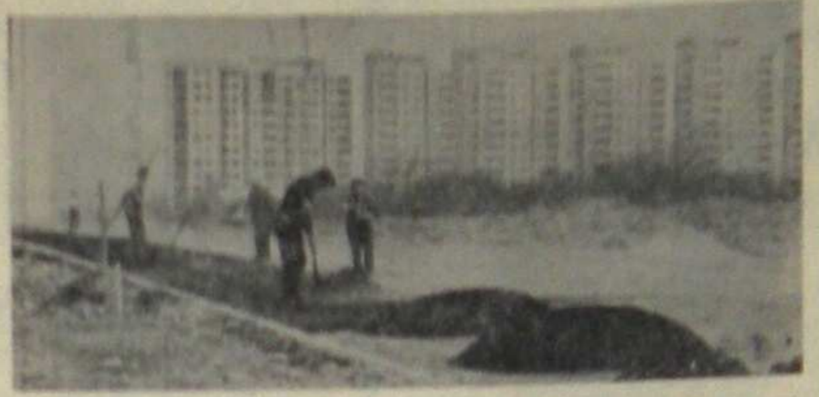
FREED KILKOMA dniami przystąpiono do asfaltowania odcinka drogi łączącej...