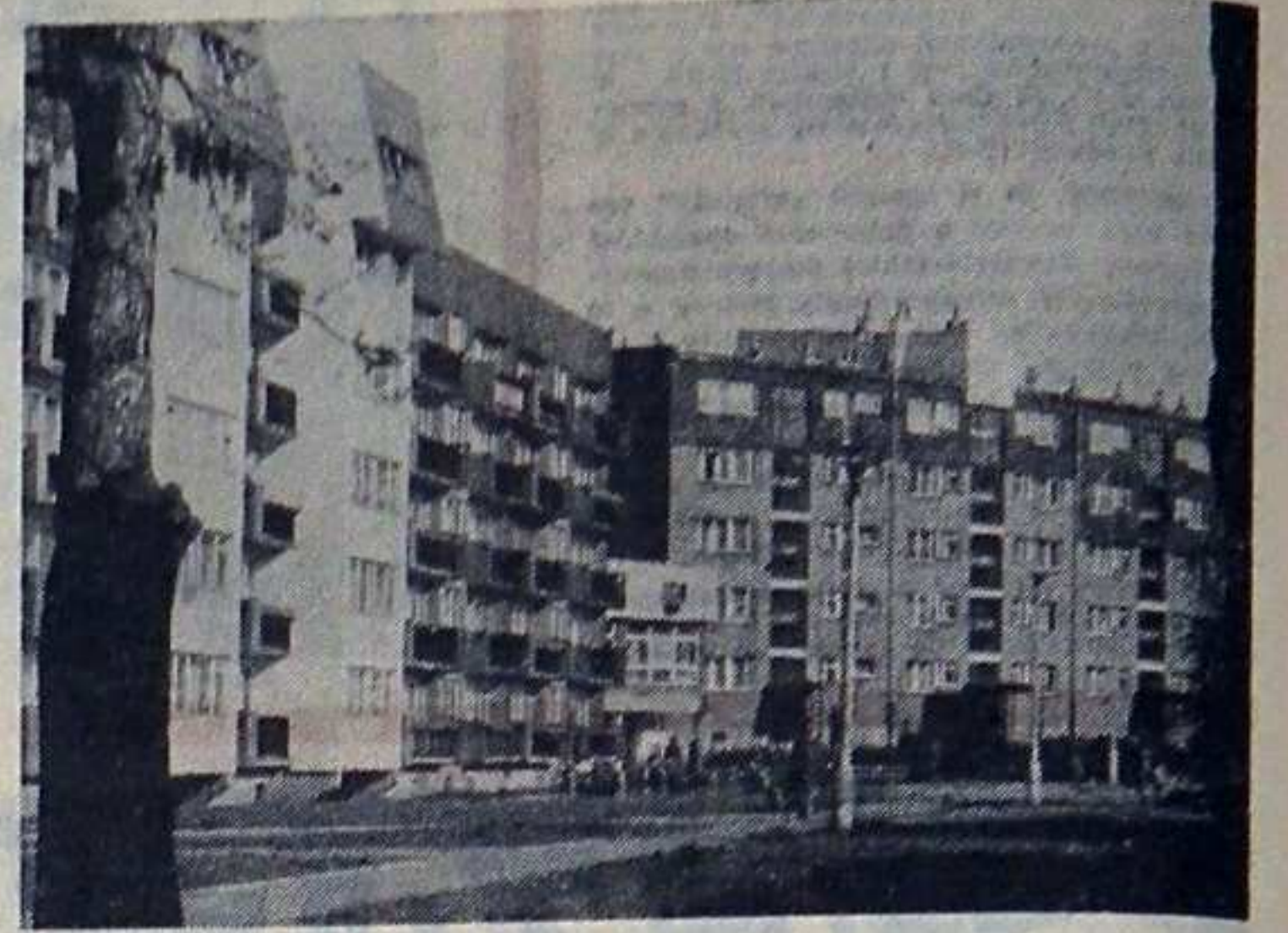
Nowa Dąbrowa Górnicza.

SKOŃCZYŁ SIĘ SEZON nie wykorzystanych skierowań na wczas. Czerwcowy przydział rozdysponowany został w całości.