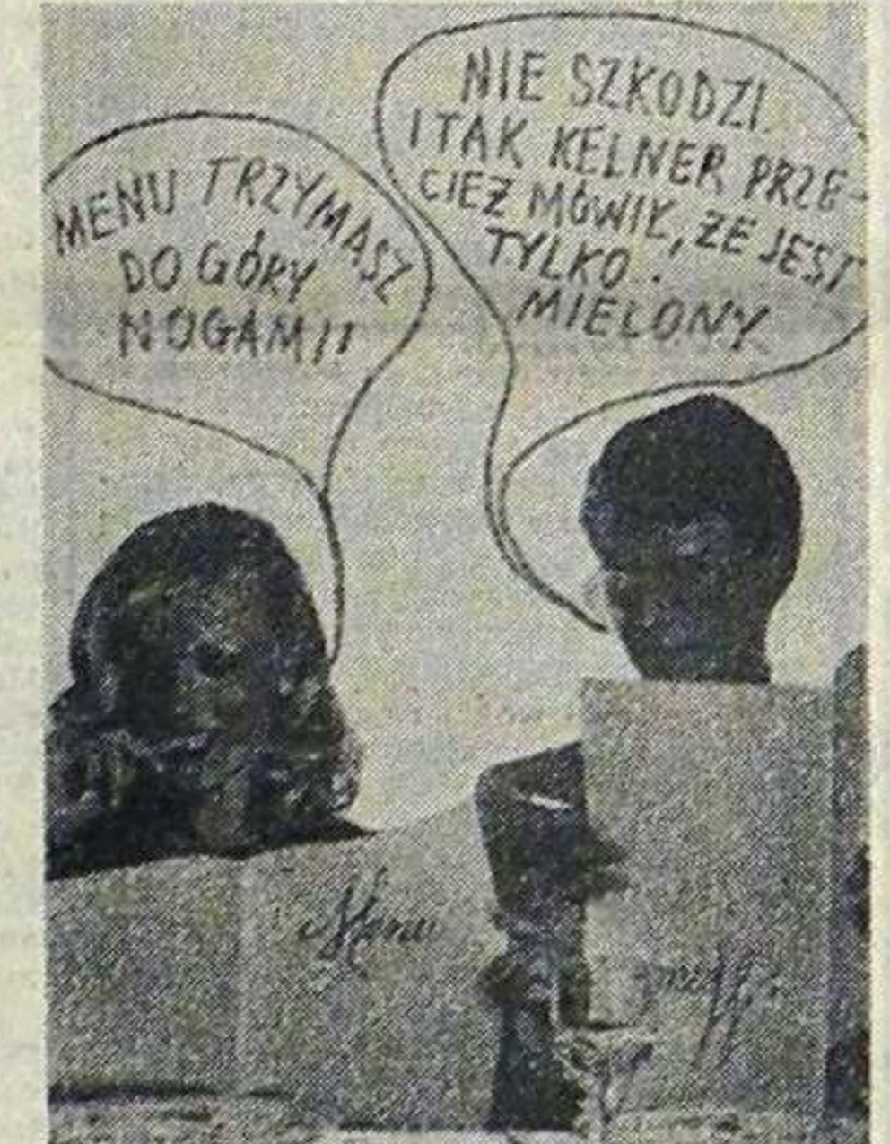
MENU TRZYMAJ DO GÓRY NOGAMI!